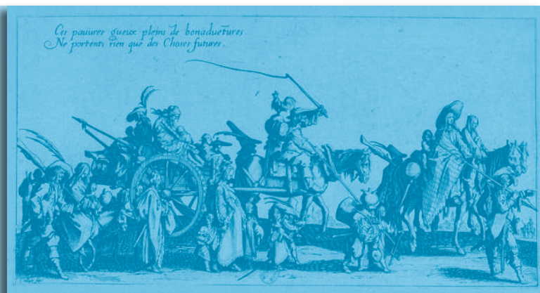
Jacques Caillot, 1621-1625 Les bohémiens en marche : l'arrière-garde