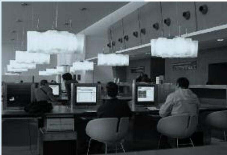
Salle de lecture des Archives et Bibliothèque Départementales Gaston Defferre.

L e t t r e d ' i n f o r m a t i o n d e l ' U M R T E L E M M E